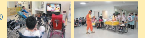
ひばりデイルーム

児童福祉法と医療法及び障害者総合支援法に基づいた児童福祉施設と病院が一緒になっています。定員40床