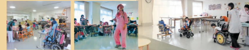
杉の子デイルーム