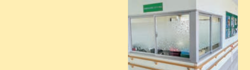
発達障害者支援部

【発達障害者支援センターふきのとう秋田】として子どもから大人まで発達障害に関連した様々な相談に応じます。